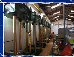
SOCIEDAD COOPERATIVA ANDALUZA SAN ISIDRO. PERIANA